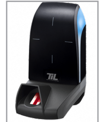
Disponible avec lecteur additionnel : Biométrique, QR-Code ou 125 kHz